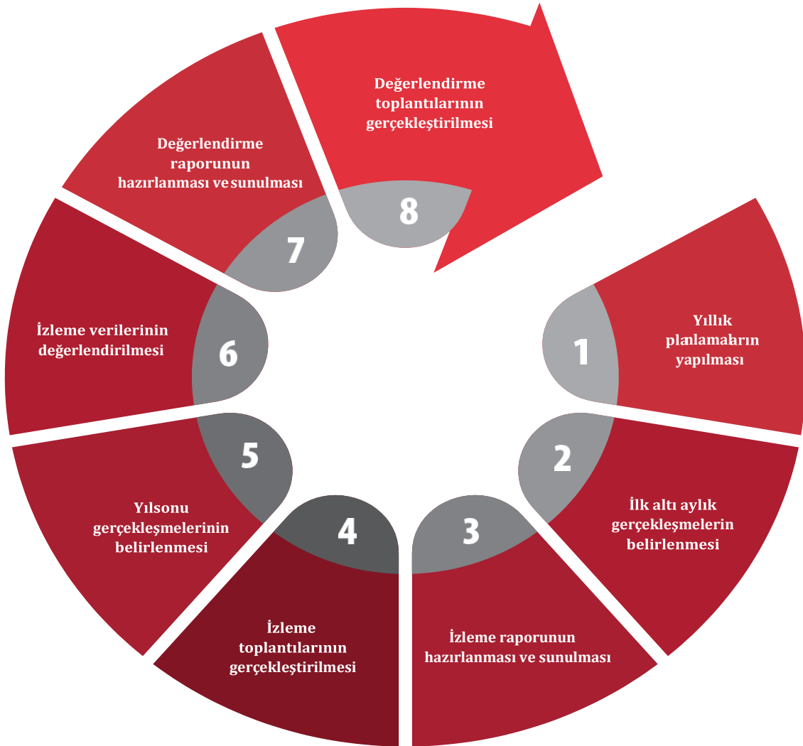
Şekil 4: İzleme ve Değerlendirme Süreci

İzleme ve değerlendirme sürecinin işleyişi ana hatları ile aşağıdaki şekilde özetlenmiştir. Babadağ Merkez Anaokulu 2024–2028 Stratejik Planı'nda yer alan performans göstergelerinin gerçekleşme durumlarının tespiti yılda bir kez yapılacaktır. Ara izleme olarak nitelendirilebilecek yılın ilk altı aylık dönemini kapsayan birinci izleme kapsamında, okul idaresi performans göstergeleri ve stratejiler ile ilgili gerçekleşme durumlarına ilişkin veriler toplanarak konsolide edilecektir. Performans hedeflerinin gerçekleşme durumları hakkında hazırlanan “Stratejik Plan İzleme Raporu” kurum amirleri ve kurum içi paydaşların görüşüne sunulacaktır. Bu aşamada amaç, varsa öncelikle yıllık hedefler olmak üzere, hedeflere ulaşılmasının önündeki engelleri ve riskleri belirlemek ve yıllık hedeflere ulaşılmasını sağlamak üzere gerekli görülebilecek tedbirlerin alınmasıdır.